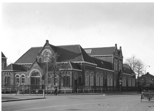
Voorgevel met links van het hoge middendeel de in 1971 afgebroken St. Janschool