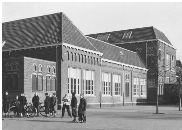
Achterzijde van de rechter vleugel (vm. St. Vitusschool) voor de verbouwing 1953-1955