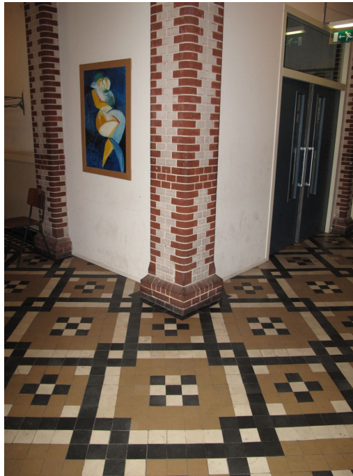
Uitgemetselde voet metselwerk pilasters in hal