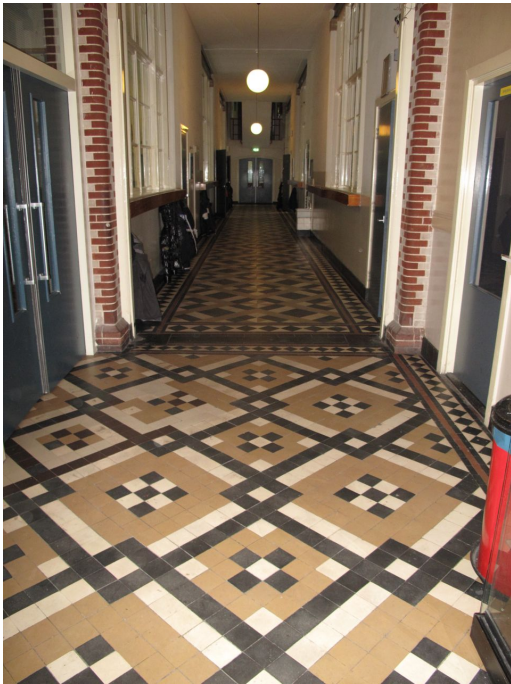
Gangen en hal hebben tegelvloeren met karakteristieke patronen