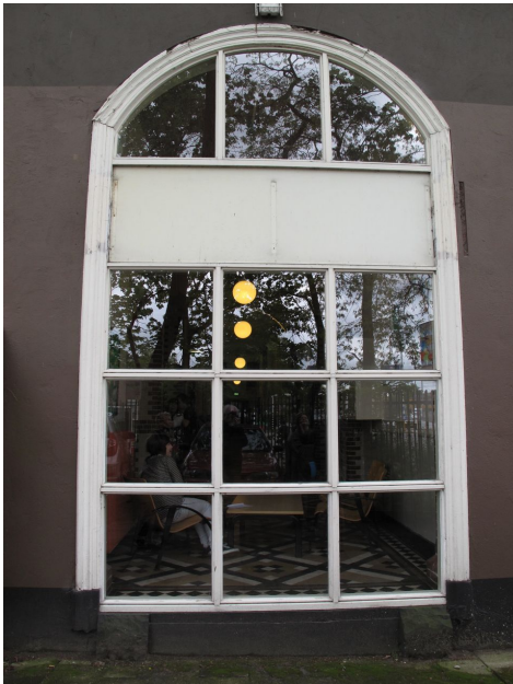
Pui in linker zijgevel

In de linker zijgevel (oost) is een pui geplaatst in het oorspronkelijke kozijn tussen de afgebroken linker vleugel.