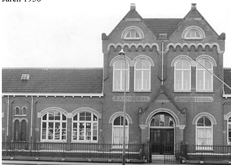
Voorgevel (St. Vitusschool)