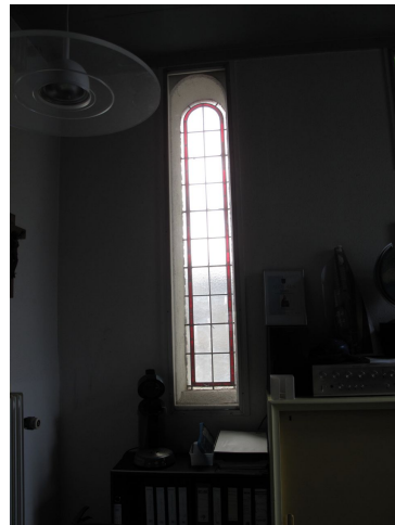
Boogvenster met glas-in-lood raam