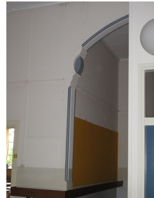
Detailering boog verdieping