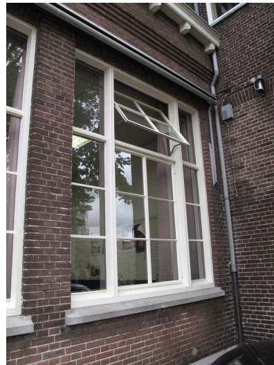
Venster in eerste travee