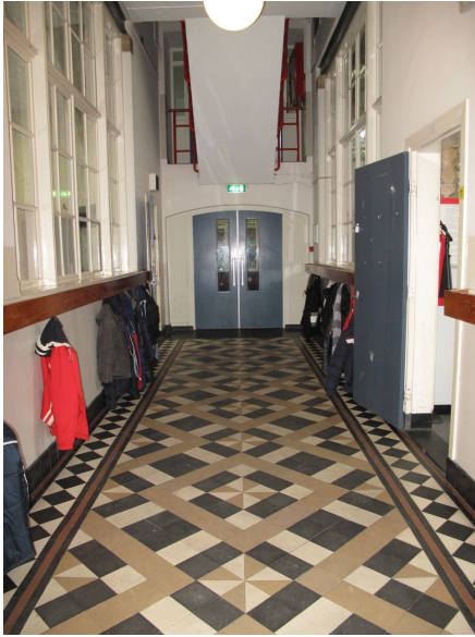
Raamkozijnen geven vanuit de gangen inkijk in de lokalen