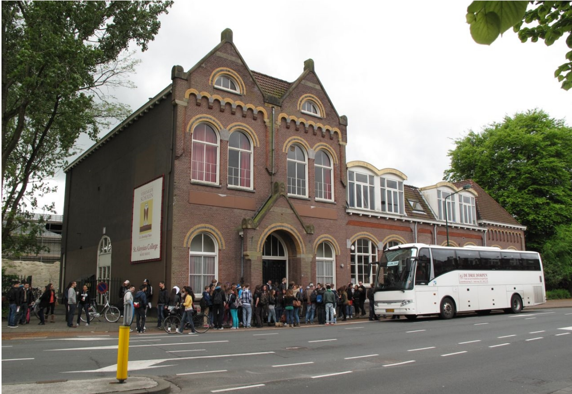
Huidige situatie, school nog in functie

Lokatie Prins Bernhardstraat 160 Monumentnummer GMH1471 Type Vm. schoolgebouw Bouwjaar 1903 Architect R. Th. Andriessen / H. Nieuwenhuysen?