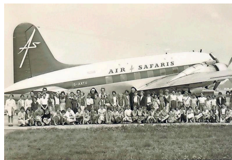
St. Annaschool op schoolreisje naar Schiphol, 1960/1961.

Ekeler en Povel willen de website stukje bij beetje uitbouwen. „Het is een stukje geschiedenis van katholiek Hilversum wat we aan het onderzoeken zijn. Zolang er nog mensen zijn die de verhalen kunnen vertellen blijft dat leuk.”