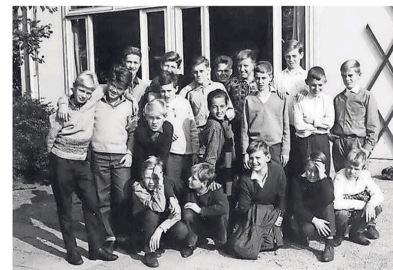
St. Vitus VGLO (dependance Kolhornseweg), 1964/1965.