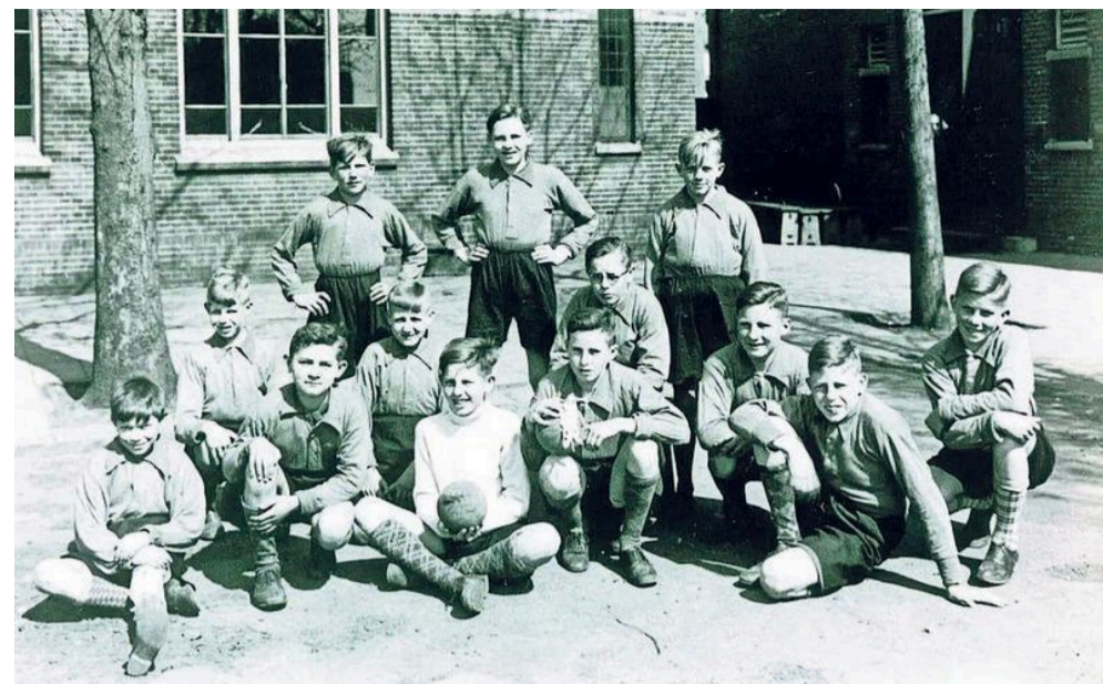
Het voetbalteam van de St. Jan lagere school in 1938.