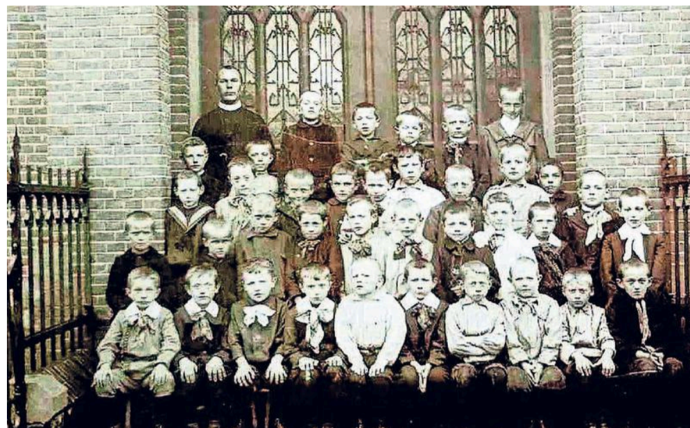
Een van de oudste klassenfoto's van de website: St. Jan lagere school, 1906.