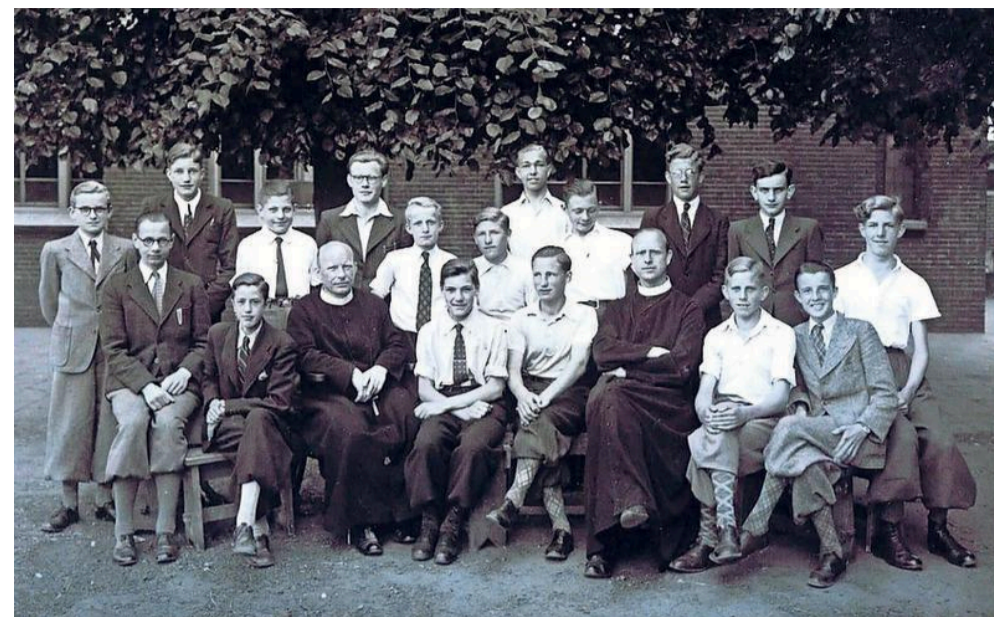
De St. Aloysius ulo/mulo in het bewogen schooljaar 1940/1941.