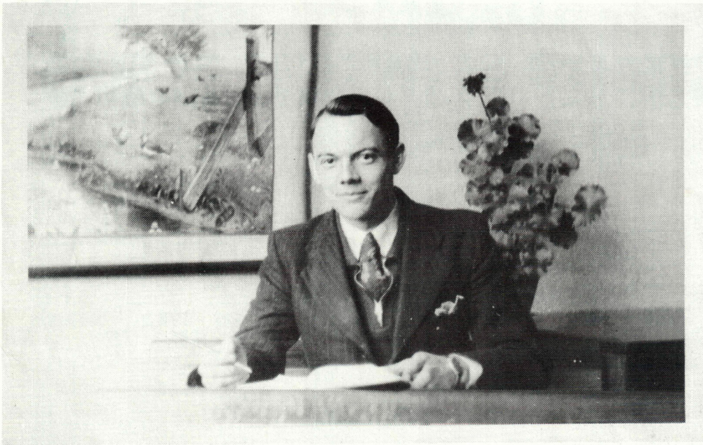
DE ONDERWIJZER VAN 22 HELE JAREN OUD... aan de St.Jansschool te Hengelo (a)