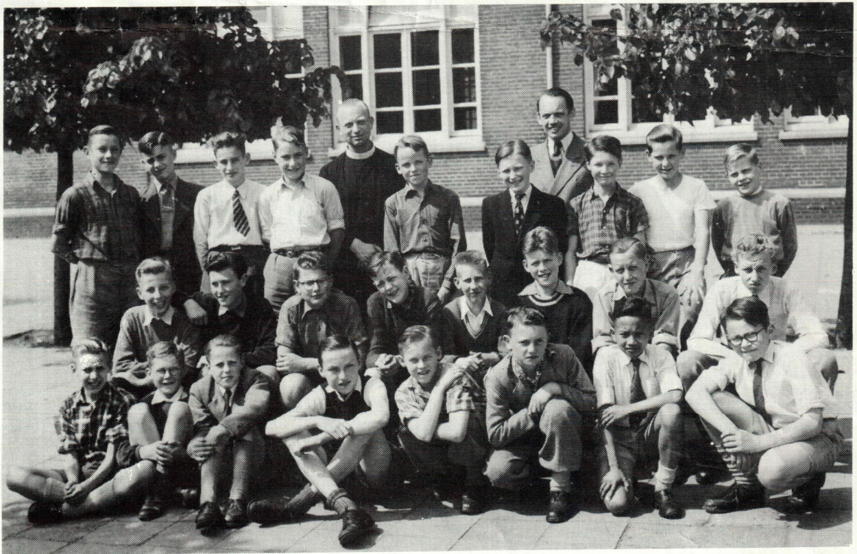
KLAS 1 C in 1953 St.Aloysius Ulo - HILVERSUM